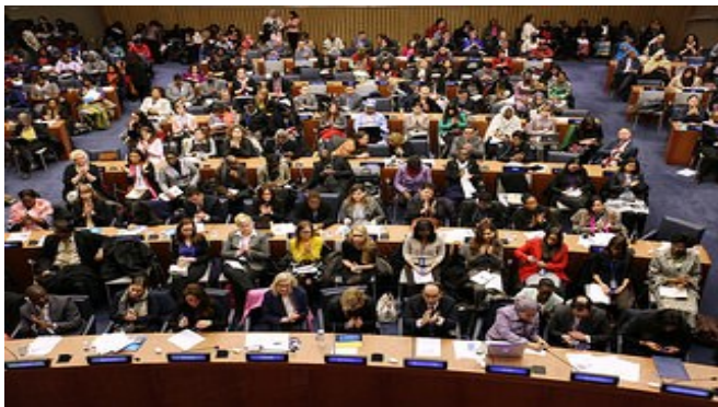
Sesión de clausura

Del 9 al 20 de marzo se celebró, en la sede de Naciones Unidas en Nueva York, el 59º periodo de sesiones de la Comisión de la Condición Jurídica y Social de la Mujer (CSW por sus siglas en inglés). Este periodo de sesiones tuvo lugar en un momento decisivo en la agenda política internacional de igualdad de género, coincidiendo con la celebración del 20º aniversario de la Declaración y Plataforma de Acción de Beijing y con el proceso de formulación de la agenda post-2015 para el desarrollo humano y sostenible.