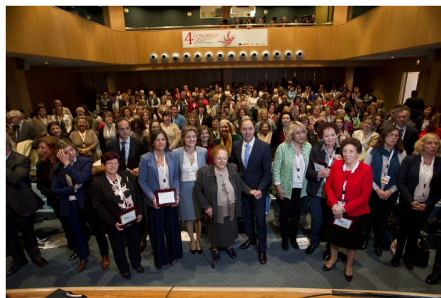
Foto de familia

Durante las dos jornadas del Congreso tuvieron lugar distintas ponencias, presentaciones, mesas redondas y talleres, donde se abordaron temas de interés, subrayándose los siguientes: