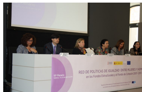
Inauguración de la Reunión plenaria de la Red