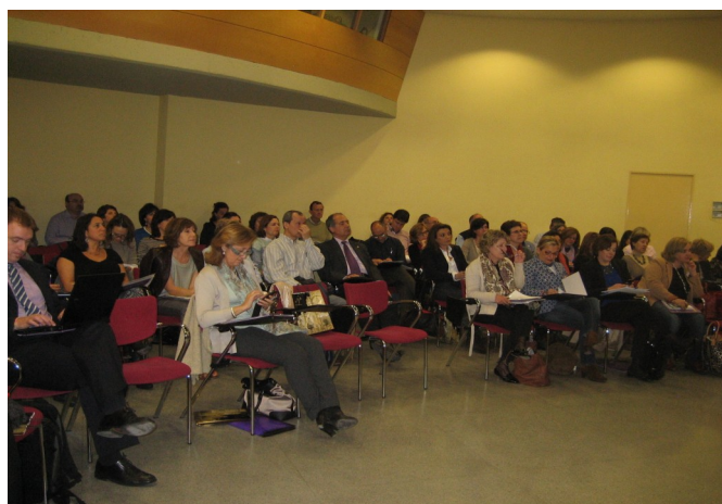
Asistentes en la Reunión plenaria de la Red en Murcia

La Red de Políticas de Igualdad entre Mujeres y Hombres en los Fondos Estructurales y el Fondo de Cohesión 2007-2013, celebró en la ciudad de Murcia los días 3 y 4 de abril de 2014, su 8ª Reunión Plenaria. En ella participaron 70 representantes de Autoridades de Gestión, Organismos Intermedios, Órganos Gestores y Organismos de Igualdad tanto de ámbito estatal como regional, que compartieron dos jornadas de trabajo en el Salón de Actos de la Consejería de Sanidad y Política Social del Gobierno de la Región de Murcia. (continúa en pág. 2)