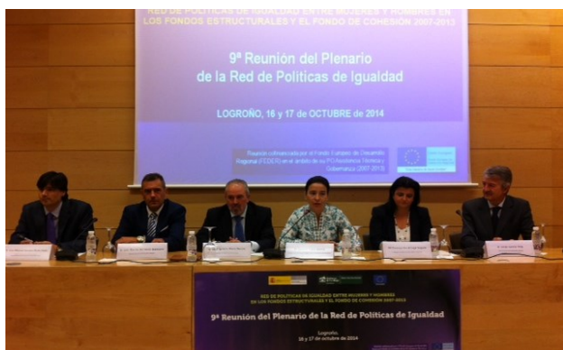
Acto de inauguración de la Reunión Plenaria de la Red en Logroño