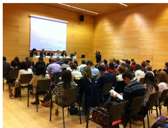
Asistentes a la Reunión plenaria de la Red en Logroño

La Red de Políticas de Igualdad entre Mujeres y Hombres en los Fondos Estructurales y el Fondo de Cohesión 2007-2013, celebró en la ciudad de Logroño los días 16 y 17 de octubre 2014, su 9ª Reunión Plenaria. En ella participaron 84 representantes de Autoridades de Gestión, Organismos Intermedios, Órganos Gestores y Organismos de Igualdad tanto de ámbito estatal como regional, que compartieron dos jornadas de trabajo en el Auditorio y Palacio de Congresos RIOJAFORUM, del Gobierno de La Rioja. (continúa en pág. 2)