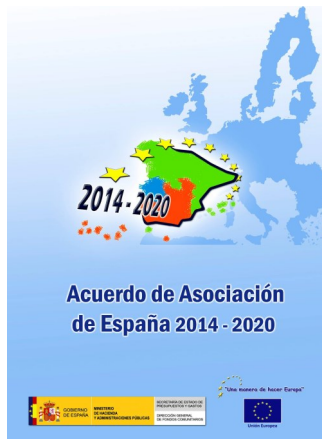
Acuerdo de Asociación (pincha imagen para ver)

tos en los Reglamentos, siendo los elementos clave de la nueva política de cohesión, las inversiones dirigidas hacia el crecimiento sostenible y la creación de empleo, con especial atención a los jóvenes y a los grupos vulnerables.