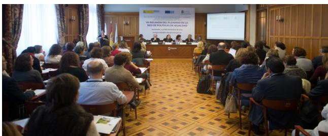
Asistencia en el plenario de la Red

En el Plenario se aprobó y presentó el Plan de Trabajo de la Red para el año 2014 , orientado, en línea con lo que se aprobó en el Plenario precedente de Avilés, a poner en valor la Red y visibilizar el trabajo realizado hasta el momento, fortalecer su estructura y contenidos, generar nuevos vínculos y reforzar los ya existentes entre Organismos Intermedios/Gestores y Organismos de Igualdad, fortalecer la capacidad de actuación de los Organismos de Igualdad de las Comunidades Autónomas, y hacer de la Red el foro clave para la integración de la igualdad de género en el próximo periodo 2014-2020.