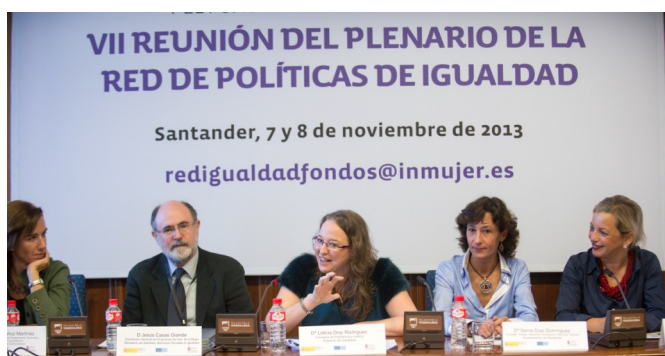
Inauguración de la 7ª reunión Plenaria de la Red